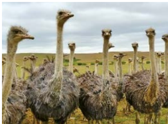
3. de struisvogel