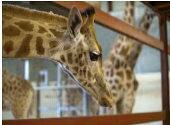
1. de giraf

Het idee hierachter is dat als u thuis deze (schooltaal) woorden in uw thuistaal bespreekt, uw kind bepaalde woorden en begrippen nog beter begrijpt op school. Het rekenen en lezen zou daardoor makkelijker kunnen gaan.