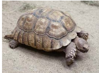
2. de schildpad