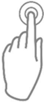
Voorbeeld van een themawoord Aanbellen