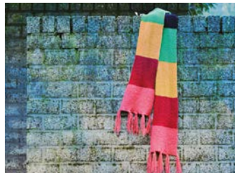
4. de sjaal