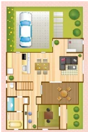
Voorbeeld van een rekenbegrip Plattegrond